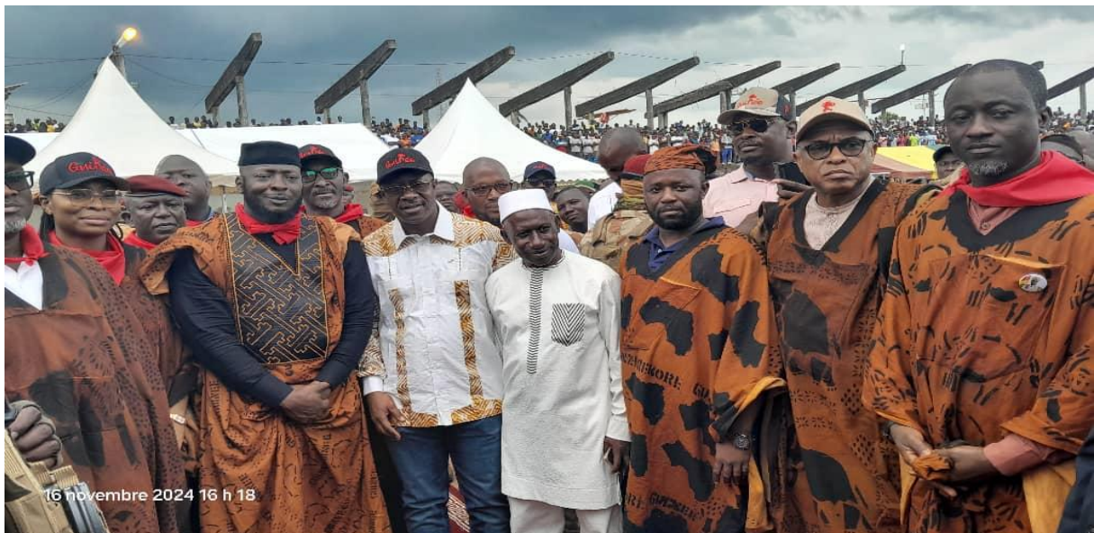
Photo de certains ministres présents à N'Zérékoré lors du lancement de ce tournoi de football doté du trophée de Mamadi Doumbouya.